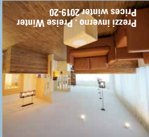
Prezzi inverno, Preise Winter Prices winter 2019-20